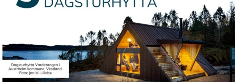
Dagsturhytta Vardetangen i Austrheim kommune, Vestland.